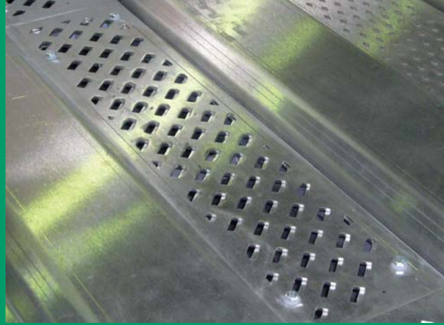
Luftaustrittsöffnungen, individuelle Querschnittsformen lieferbar, optional mit Verstellvorrichtung