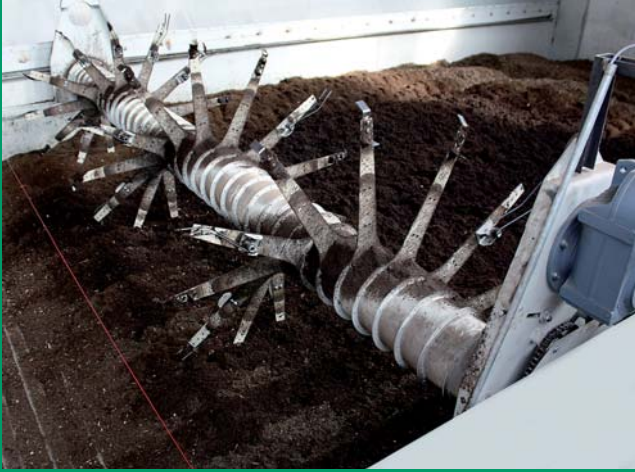
Misch- und Förderwalze